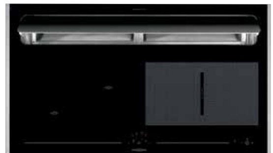
KXI 1092 mit offener Absaugklappe und Seitenleisten