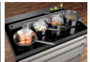
KXI 1092 mit Pfanne und 3 Töpfen