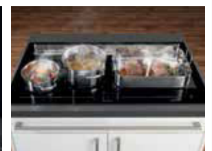
KXI 1092 mit Bräter und 2 Töpfen