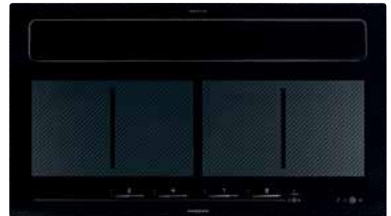
KFL 2094 mit geschlossener Absaugklappe