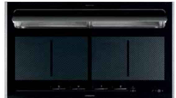
KFL 2094 mit offener Absaugklappe und Seitenleisten